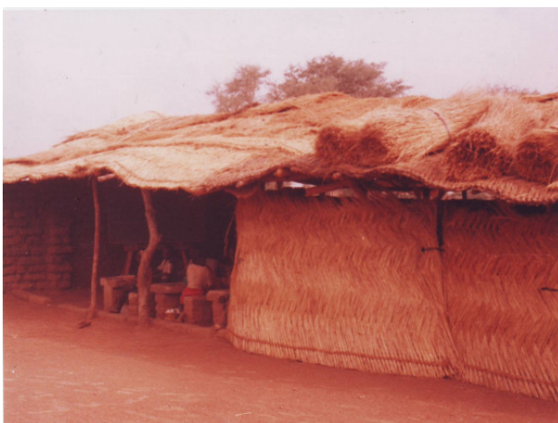
Klassenraum im Schuljahr 2006/2007

Ein Klassenraum wurde mit Strohmatte abgedeckt, Bänke und Tische wurden von den Eltern aus Lehm gebaut. Die Eltern bezahlten gemeinsam einen Lehrer. Im ersten Schuljahr 2006/2007 wurden bereits 73 Kinder unterrichtet, davon erfreulicherweise 37 Mädchen und 36 Jungs!