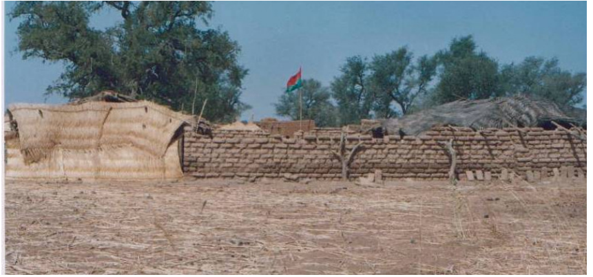
Erweiterte Unterrichtsräume im Schuljahr 2008 /2009

Die Eltern einen daraufhin einen provisorischen zweiten Unterrichtsraum geschaffen, so dass im 3. Schuljahr 2008/2009 bereits 140 Kinder in zwei Klassen unterrichtet werden konnten. Inzwischen sind dort zwei Lehrer angestellt, die von der Regierung bezahlt werden.