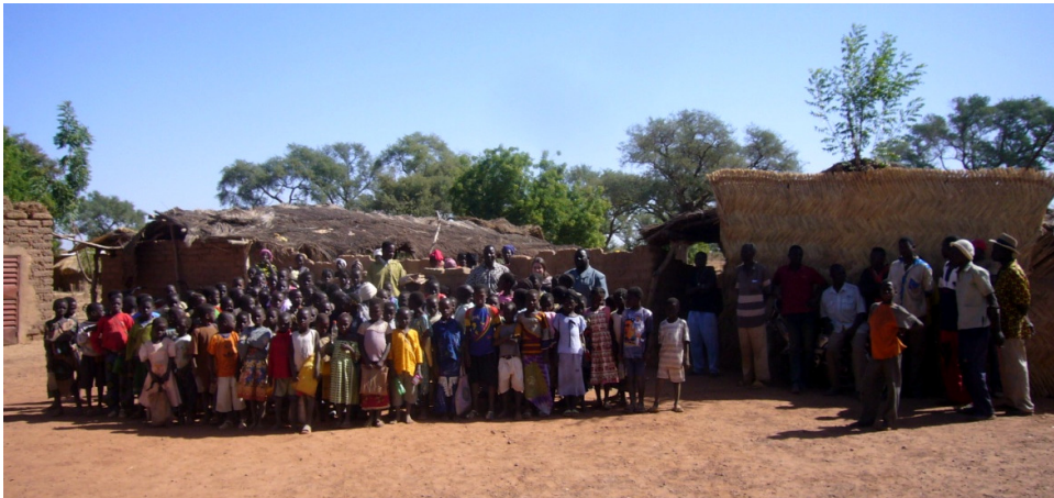
Eltern und Kinder vor der Schule 2010

Im 4. Schuljahr 2009/2010 wurde weiter in zwei Klassen unterrichtet. Eine neue Klasse konnte nicht eröffnet werden, weil die Mittel fehlten. Das bedeutet, dass viele Kinder auf ihre Einschulung warten.